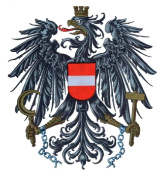
Republik Österreich: Bundesadler