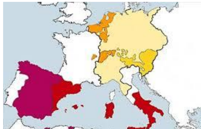
Europa nach der Teilung der habsburgischen Besitzungen 1556

Durch eine geschickte Heiratspolitik gelang es den Habsburgern, ihre Hausmacht im Reich zu vergrößern. Die Heirat von Maximilian I. mit Maria, der Erbtochter von Burgund, brachte die reichen Niederlande (1477). Die Ehe seines Sohnes Philipps mit der spanischen Erbprinzessin Johanna von Kastilien (1496) brachte die spanische Krone mit den südamerikanischen Kolonien und dem Königreich Neapel-Sizilien in den habsburgischen Besitz. Kaiser Karl V., Philipps Sohn und Nachfolger (1516), konnte behaupten, über ein Reich zu regieren, ‚in dem die Sonne nicht unterging‘.