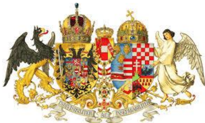
Wappen der k. u. k. Monarchie Österreich-Ungarn