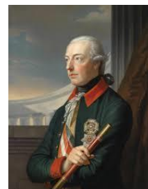
Karl V. Maria Theresia und Franz I. von Lothringen Joseph II.